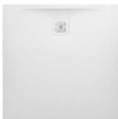
Sprchová vanička 90×90 cm