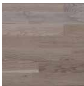
Dub bělený lak