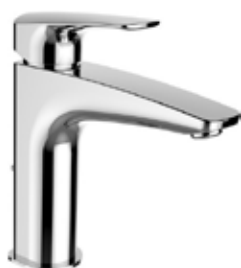
Umyvadlová baterie – Laurin technologie Studený start – systém úspory energie