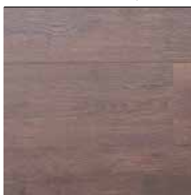
Dub Brazilian Brown