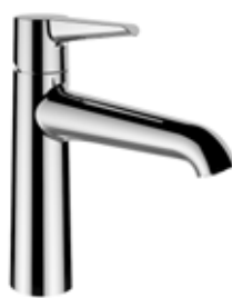
Umyvadlová baterie – Val