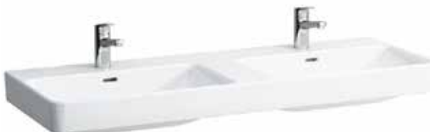
Dvojumyvadlo 120×46 cm