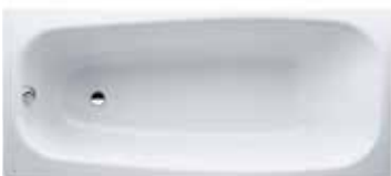
Vana 170×75 cm