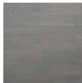
Dub Warm Cotton