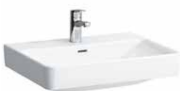
Umyvadlo 60×46 cm