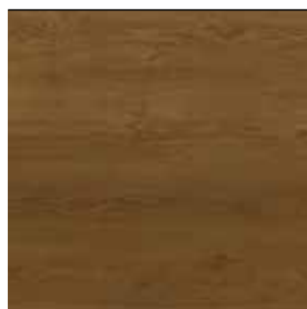
Dub tmavě hnědý