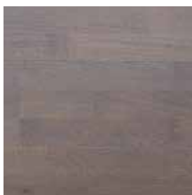
Dub Elephant Grey