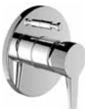
Baterie vanová, sprchová – Val