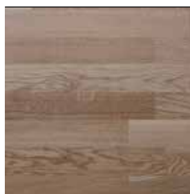
Dub přírodní lak