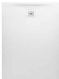
Sprchová vanička 100×80 cm