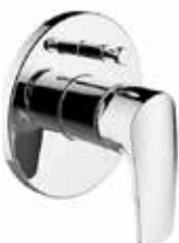
Baterie vanová, sprchová – Laurin technologie Studený start – systém úspory energie