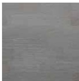
Dub Grey Harmony