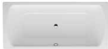
Vana 180×80 cm