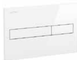
Splachovací tlačítko bílá