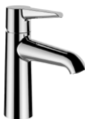
Umývátková baterie – Val