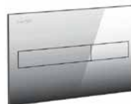
Splachovací tlačítko chrom