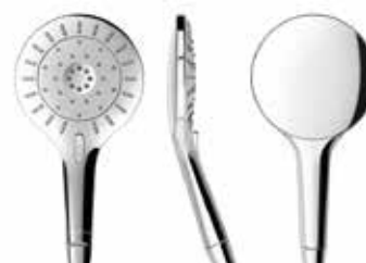
Laufen Mytwin Vanové a sprchové příslušenství