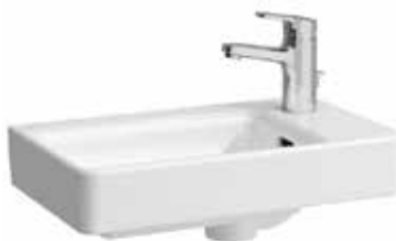
Umývátko 48×28 – pravé