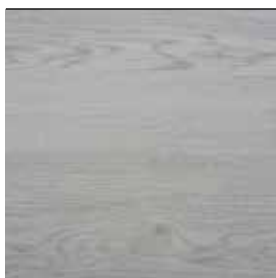
Dub světle šedý