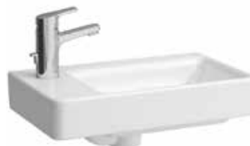
Umývátko 48×28 – levé