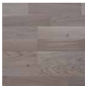
Dub Finale přírodní