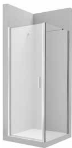
Otevíravé dveře 900 mm