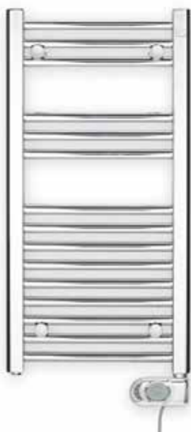
Koupelňový radiátor 906×500 cm